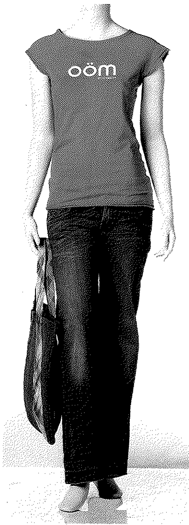
T-SHIRT 100 % COTON BIOLOGIQUE CERTIFIÉ (OÖM ETHIKWEAR, 38 $), JEAN 98 % COTON BIOLOGIQUE ET 2 % ÉLASTHANNE, COLLECTION ECO BIO LEVI'S ROUGE (LEVI'S, 110 $), FOURRE-TOUT EN JEAN 100 % RECYCLÉ (FALAKOLO, 22 $)