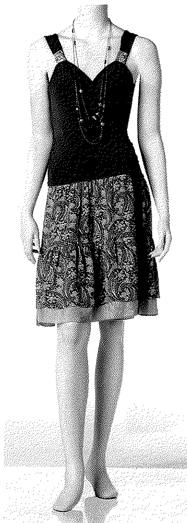
ROBE STRETCH À JUPE DE CHIFFON, CRÉÉE À PARTIR DE DEUX ROBES ET D'UN CHANDAIL (ON & ON, 190 $), COLLIER VICTORIA COMPOSÉ DE CHÂÎNES, DE BOUTONS ET DE PERLAGE RECYCLÉS (ROSE FLASH, 60 $)